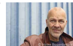
Jens Henrik Jensen

Web: www.mordamhellweg.de und an allen HellwegTicket-VVK-Stellen.